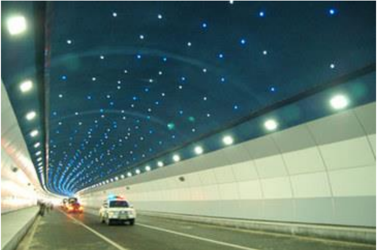
Bilde av ferdig tunell.

Med en slik tunellbygging blir sikkerheten godt varetatt.